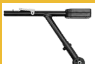
Dispositivo d'aiuto ribaltamento