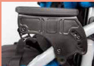
Bracciolo regolabile in altezza