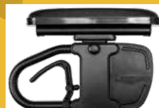
Braccioli estraibili imbottiti regolabili in altezza e profondità