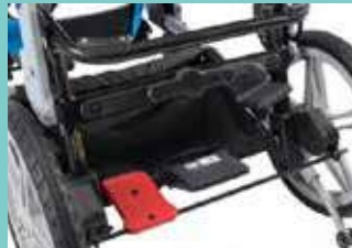
Freno a pedale