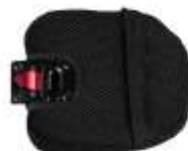
Supporto laterale L 11,5 cm x 11,5 cm