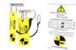
Dispositivi di ritenuta per attacchi a 2 punti Estraibili Regolabili, omologati per trasporto in auto