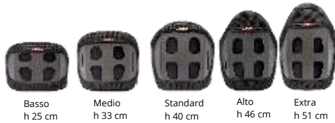
Basso h 25 cm Medio h 33 cm Standard h 40 cm Alto h 46 cm Extra h 51 cm