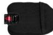
Supporto laterale XL 10 cm x 15 cm