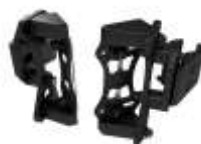
Attacchi a 2 punti Fissi Regolabili (2)