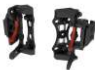
Attacchi a 2 punti Estraibili Regolabili (R)

ADI-CFBR(LARGHEZZA SCHIENALE IN ") (ALTEZZA) (PROFILO) (ATTACCO) es. Schienale largo 40 cm, alto 33 cm, avvolgente, attacchi estraibili ADI - CFBR 16 M D R