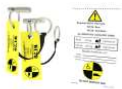
Dispositivi di ritenuta per attacchi a 2 punti Estraibili Regolabili, omologati per trasporto in auto