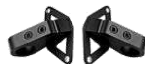
Attacchi a 2 punti Fissi (F)