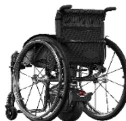
AGGANCIO POSTERIORE MODALITA' CONTROLLER