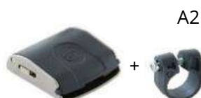
Attacco Cinch Metallo + Salvatelaio in Nylon