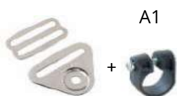
Attacco Flat Metallo + Salvatelaio in Nylon