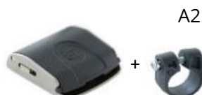
Attacco Cinch Metallo + Salvatelaio in Nylon