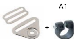
Attacco Flat Metallo + Salvatelaio in Nylon