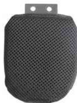
Small (hxp) 7,5 cm x 7,5 cm Medium (hxp) 7,5 cm x 10 cm Large (hxp) 11,5 cm x 11,5 cm