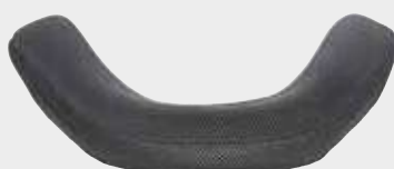
Avvolgente - profondità 10 cm