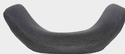
Avvolgente - profondità 10 cm