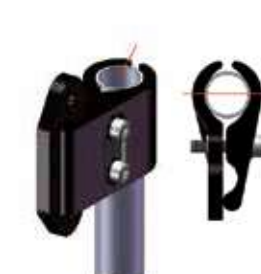
Sezione tubo Tonda 0,75"/19,05 mm