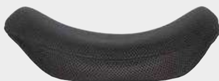
Attivo - profondità 6 cm