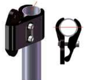
Sezione tubo Tonda 1"/25,4 mm

Gli attacchi possono essere montati sulla maggior parte delle carrozzine attraverso morsetti regolabili in grado di adattarsi ai tubi schienale di diversi diametri e forme senza bisogno di riduttori.