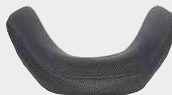
Extra Avvolgente - profondità 15 cm