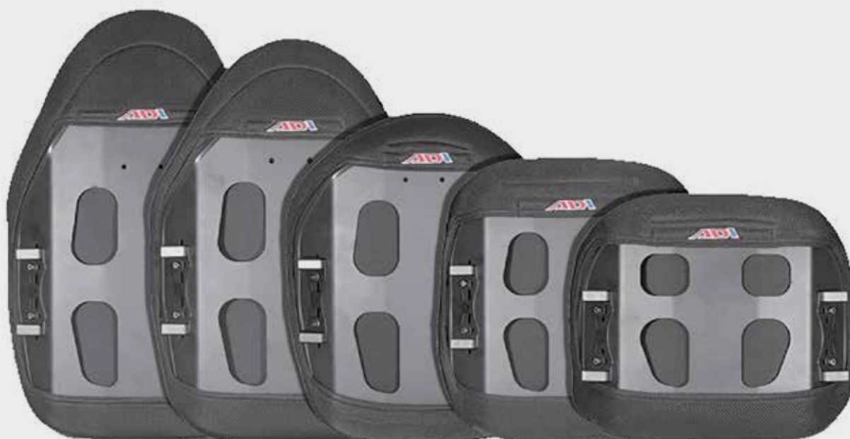
Extra 51 cm