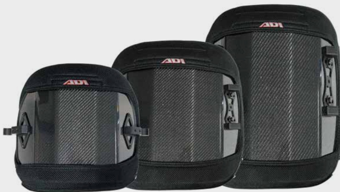
Basso - 25 cm