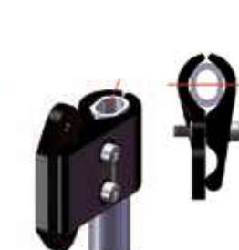
Sezione tubo Ovale 0,60"/15,24 mm